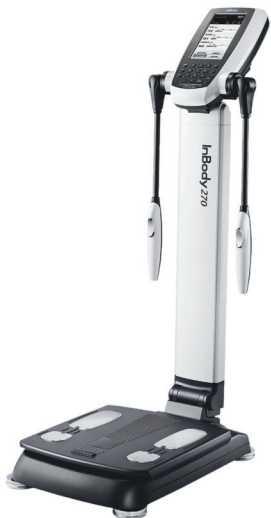
InBodyによる 体組成計測定

InBody（体成分分析装置）での体組成計測定と その方に合わせた個別の運動指導が受けられます。