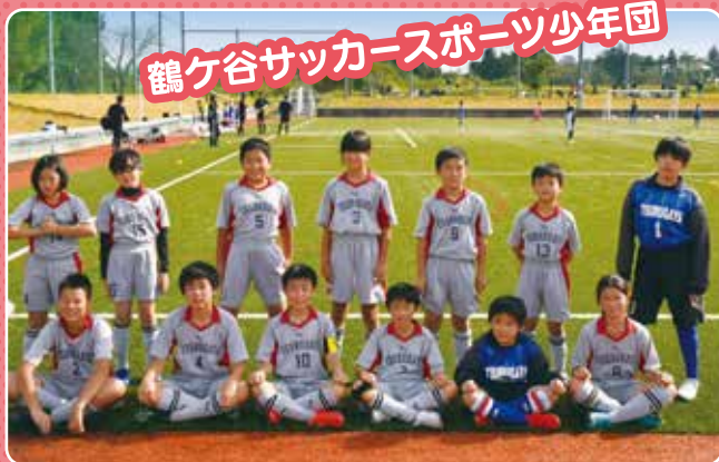
鶴ヶ谷サッカースポーツ少年団