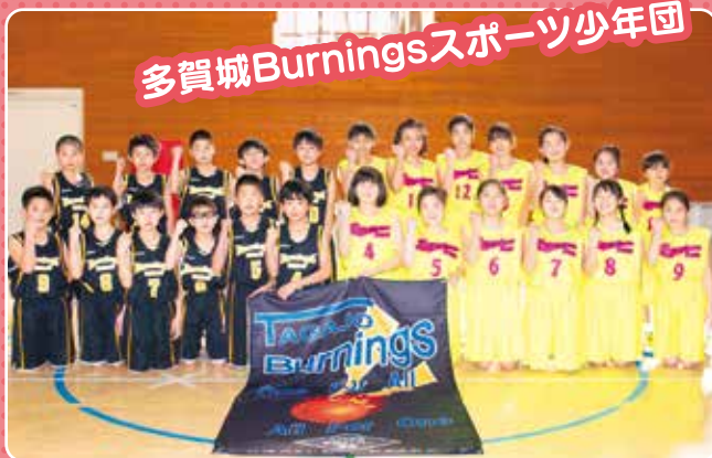
多賀城Burningsスポーツ少年団